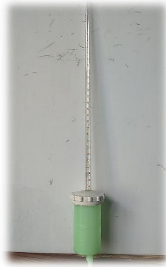
Gambar 3.7. Tangki Bahan Bakar