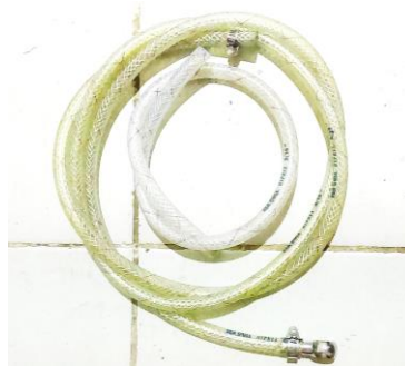
Gambar 3.10. Selang Bahan Bakar

Selang ini berfungsi untuk menyalurkan bahan bakar dari tangki ke pompa injector.