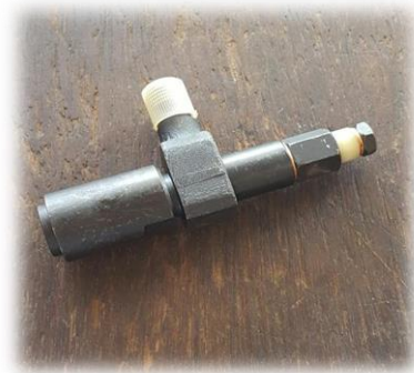
Gambar 3.12 Injektor

Injektor berfungsi untuk menghantarkan bahan bakar dari pompa injektor ke dalam silinder pada setiap akhir langkah kompresi dimana piston mendekati TMA.