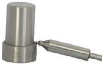
Gambar 3.13 Nosel

Nosel ini berfungsi sebagai penyemprot bahan bakar ke dalam ruang bakar.