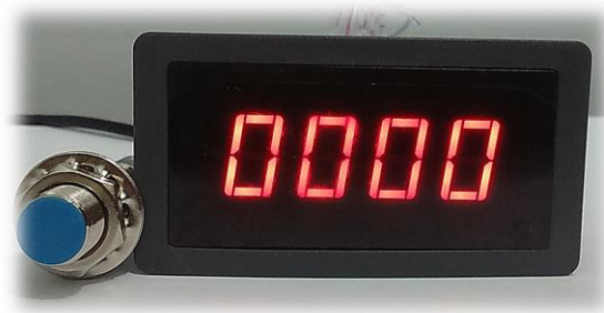
Gambar 3.3. Tachometer Digital

Tachometer digital ini digunakan untuk menghitung atau mengukur putaran mesin (rpm). Alat ini dilengkapi dengan Hall Proximity Switch Sensor NPN . Alat ini juga dapat menghitung putaran mesin hingga 9999 rpm.