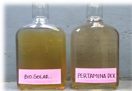
Gambar 3.2. Biosolar dan Pertamina Dex