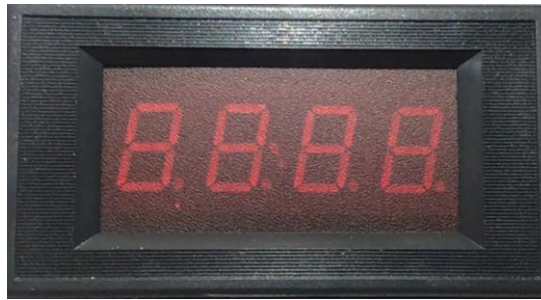
Gambar 3.5. Ampere Meter Digital

Ampere meter digital ini digunakan untuk mengukur arus yang dihasilkan oleh dynamo alternator pada mesin diesel setelah diberi pembebanan berupa lampu. Alat ini memiliki kapasitas dari 0-20 Ampere.