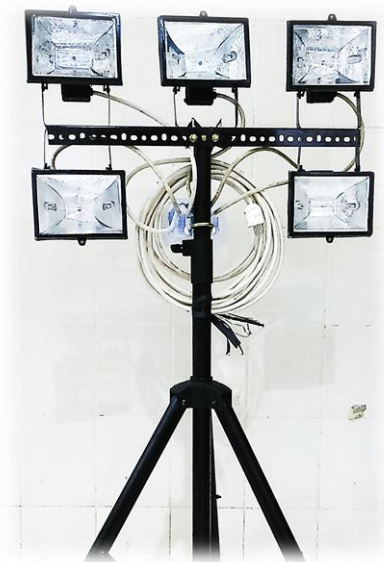
Gambar 3.8. Lampu

Lampu ini digunakan untuk membebani dynamo alternator pada mesin diesel. Jumlah lampu yang digunakan adalah 5 buah lampu, masing-masing lampu memiliki daya sebesar 500 watt.