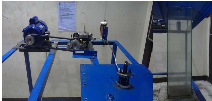
(a) Tampak Atas