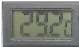
Gambar 3.6. Termometer Digital

Thermometer digital ini digunakan untuk mengukur temperature udara masuk, gas buang, air pendingin dan oli/ minyak pelumas pada mesin diesel. Alat ini memiliki kapasitas dari 0-110 0 C.