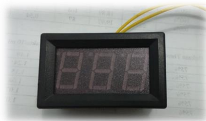
Gambar 3.4. Voltmeter Digital

Voltmeter digital ini digunakan untuk mengukur tegangan yang dihasilkan oleh dynamo alternator pada mesin diesel. Alat ini memiliki kapasitas dari 3-300 volt.