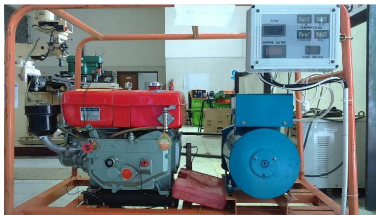
Gambar 3.1. Mesin Diesel Jiangdong