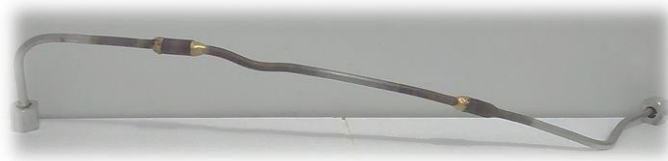
Gambar 3.9. Selang Nosel

Selang nosel berfungsi untuk mengalirkan bahan bakar dari pompa injector ke nosel.