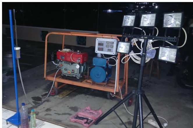
Gambar 3.16. Pengujian kinerja mesin diesel