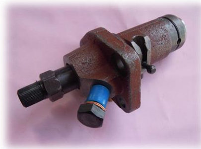
Gambar 3.11. Pompa Injektor

Pompa ini berfungsi untuk memompa bahan bakar dari tangki ke selang nosel kemudian disalurkan ke nosel.