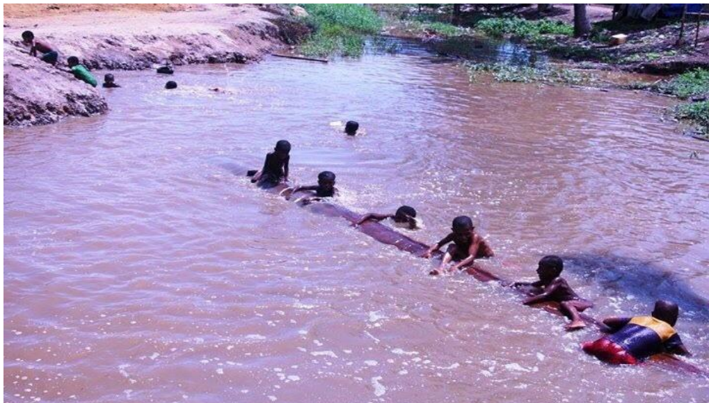
Kondisi Sungai Warmon.