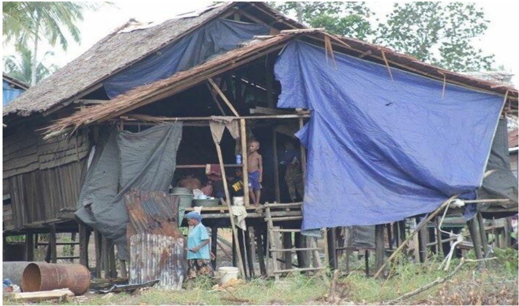
Kondisi Pemukiman Warga Desa Warmon Kokoda.