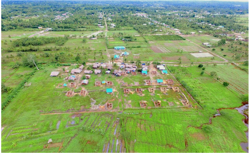
Kondisi Wilayah Desa Warmon Kokoda. Sumber: Dokumentasi TIM KKN Mandiri MBN-Papua