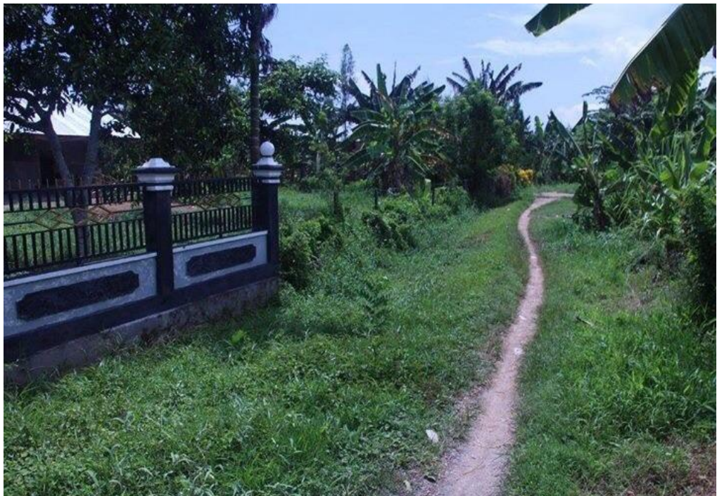
Kondisi Batas Wilayah Pemukiman Warga Transmigran dan Warga Desa Warmon Kokoda.