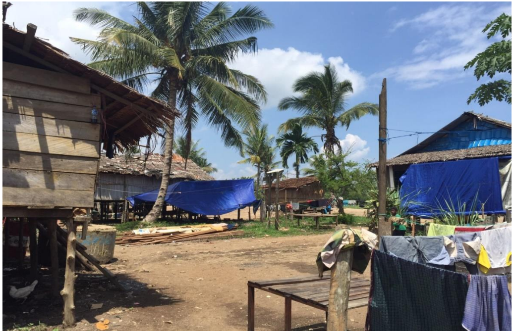
Kondisi Pemukiman Warga Desa Warmon Kokoda.