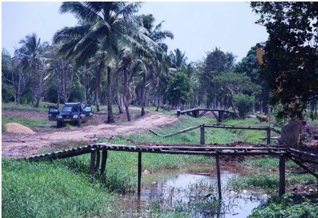
Kondisi Infrastruktur Jembatan Desa Warmon Kokoda.