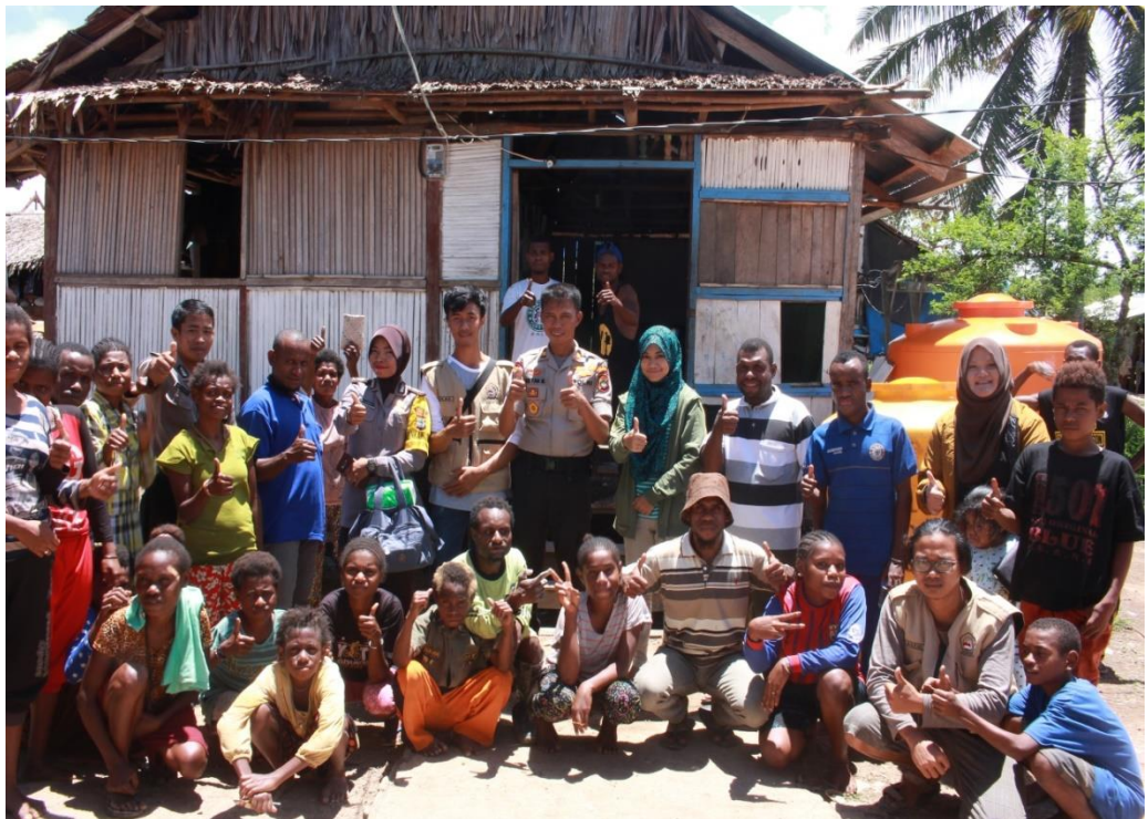
Kondisi Balai Desa Warmon Kokoda.