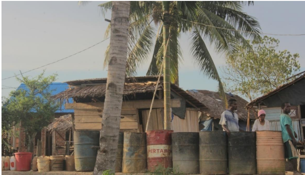
Kondisi Antri Air Bersih Warga Desa Warmon Kokoda.

Berdasarkan gambar 2.10, menjelaskan bahwa masyarakat suku Kokoda juga mengalami kesulitan untuk memenuhi kebutuhan air bersih. Jika kemarau, masyarakat antri untuk mendapat air bersih yang dibantu oleh pemerintah desa. Terkadang masyarakat memenuhi kebutuhan air bersih dengan berjalan kaki menuju desa sebrang yang ditempuh dengan jarak 2 Km.