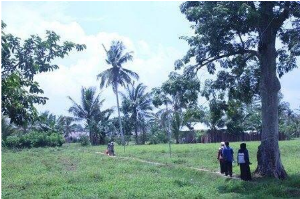
Kondisi Infrastruktur Jalan Desa Warmon Kokoda.