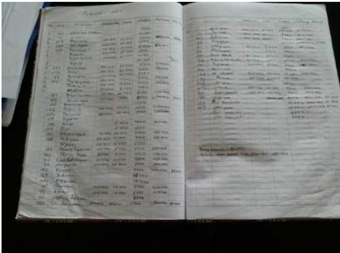
Gambar 3 : Foto buku induk koperasi