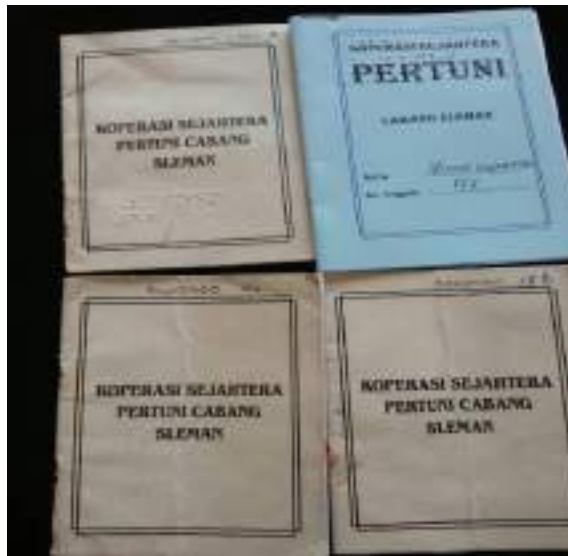
Gambar 1 : Foto buku tabungan koperasi

Sebelumnya pencatatan dengan menggunakan cara yang manual dengan proses, anggota datang kemudian dicatat berapa iuran sukarela dan jasa yang diberikan serta uang angsuran ke dalam buku anggota kemudian dimasukkan dalam buku induk secara manual . Dengan model pencatatan ini dirasa masih belum efektif.