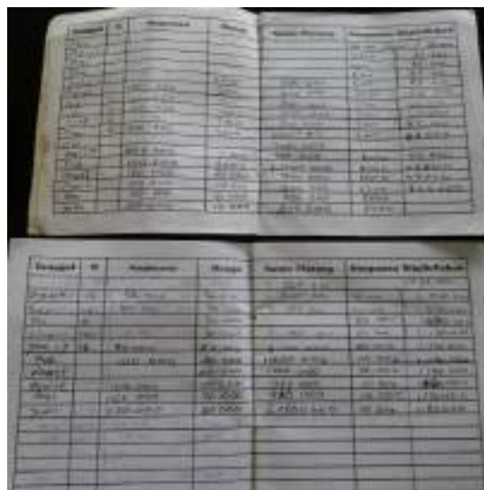
Gambar 2 : Foto buku transaksi