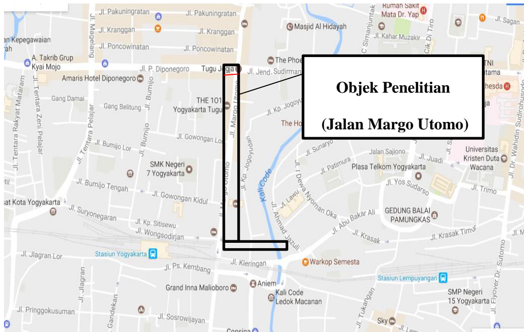
Gambar 4.1 Lokasi Penelitian

Objek data penelitian ini dilakukan pada suatu ruas Jalan Margo Utomo Kota Yogyakarta. Letak geografis Kota Yogyakarta berada pada 7^{\circ} 15' 24'' LS - 7^{\circ} 49' 26'' LS dan 110^{\circ} 24' 19'' BT - 110^{\circ} 28' 53'' BT dengan ketinggian rata-rata 114 meter di atas permukaan laut. Kota Yogyakarta memiliki luas wilayah yang sempit yaitu 32,5 \text{ Km}^2 yang berarti 1,025% dari luas wilayah Provinsi D.I.Yogyakarta. Kota Yogyakarta terletak ditengah-tengah Provinsi D.I.Yogyakarta, dengan batas-batas wilayah, sebelah utara berbatasan dengan Kabupaten Sleman, sebelah timur berbatasan dengan Kabupaten Bantul dan Sleman, sebelah selatan berbatasan dengan Kabupaten Bantul, sebelah barat berbatasan dengan Kabupaten Bantul dan Sleman. Penelitian ini berlokasi di salah satu jalan protokol yang terdapat di Kota Yogyakarta, Jalan Margo Utomo.