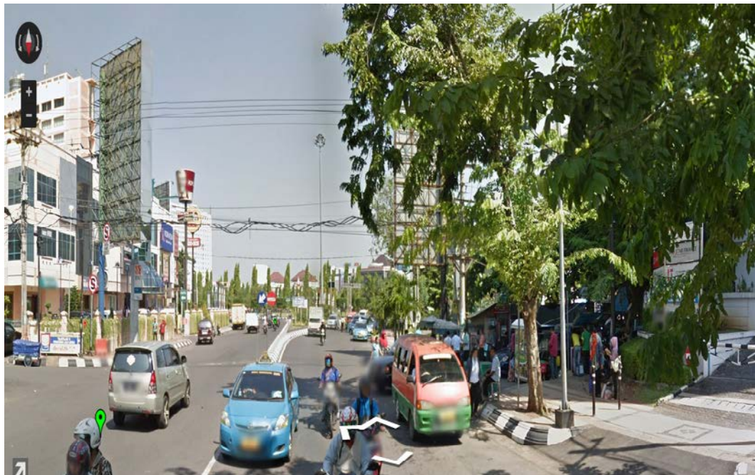
Gambar 5. Simpang Gajah Mada tampak Selatan