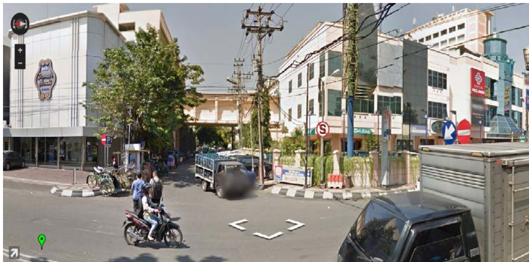
Gambar 2. Simpang Jl. Gajah Mada tampak Timur