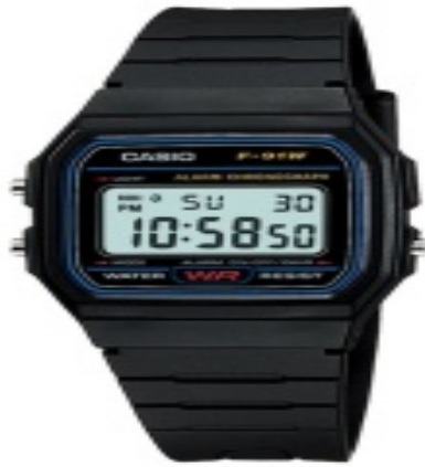
Gambar 1. Peralatan Survei (Jam Tangan)