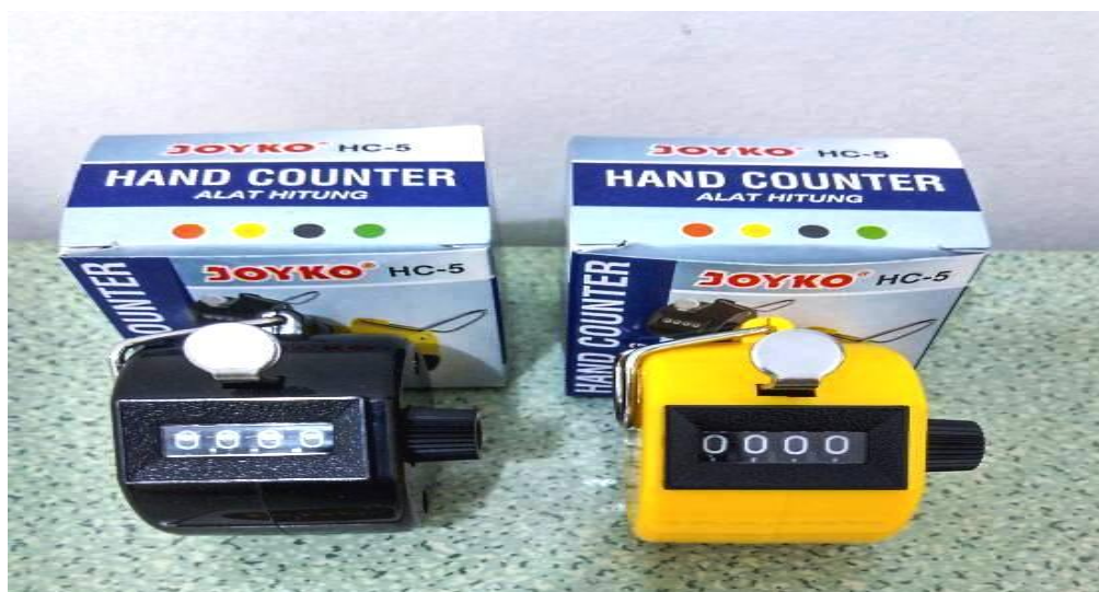
Gambar 3. Peralatan Survei ( Hand Counter )