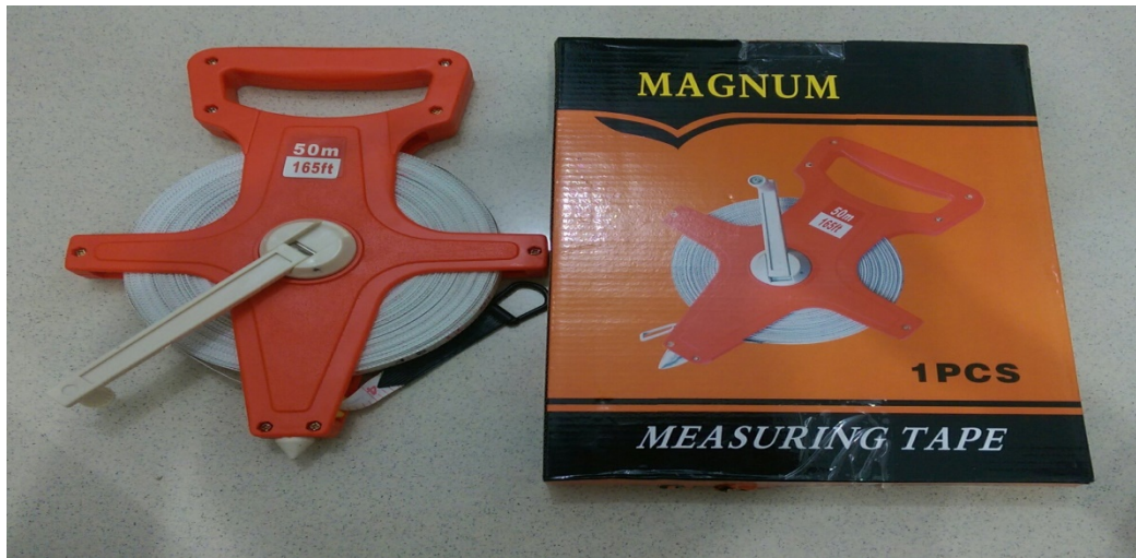
Gambar 2. Peralatan Survei (Meteran 50 m)