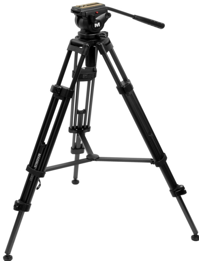
Gambar 5. Peralata Survei ( Tripod )