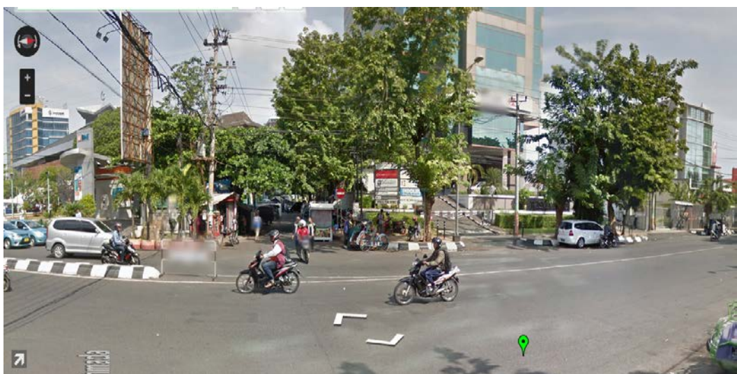
Gambar 3. Simpang Jl. Gajah Mada tampak Barat