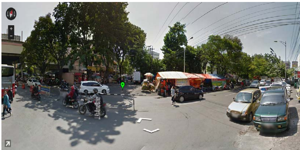
Gambar 8. Simbang Jl. Kh. Ahmad Dahlan tampak Barat