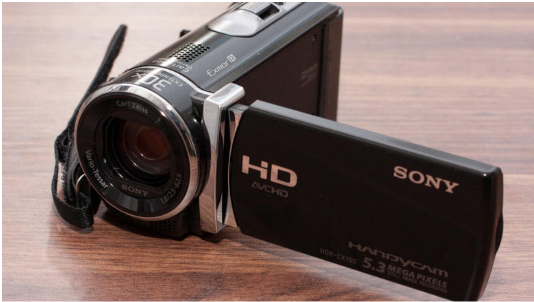
Gambar 4. Peralata Survei ( Handycam )