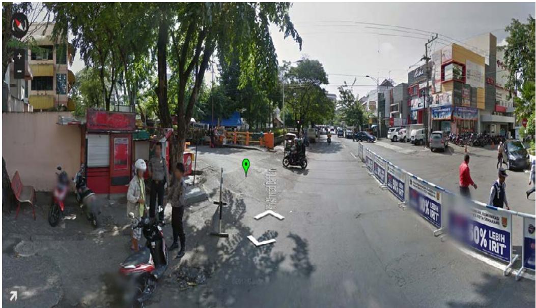
Gambar 10. Simpang Jl. Kh. Ahmad Dahlan tampak Utara