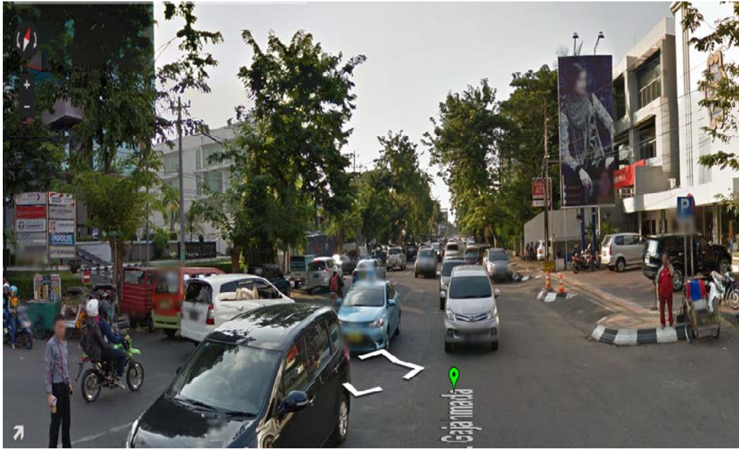
Gambar 4. Simpang Gajah Mada tampak Utara