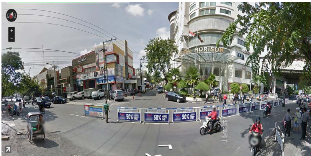
Gambar 7. Simbang Jl. Kh. Ahmad Dahlan tampak Timur