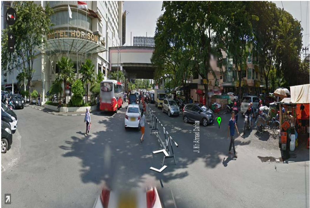
Gambar 9. Simpang Jl. Kh. Ahmad Dahlan tampak Selatan