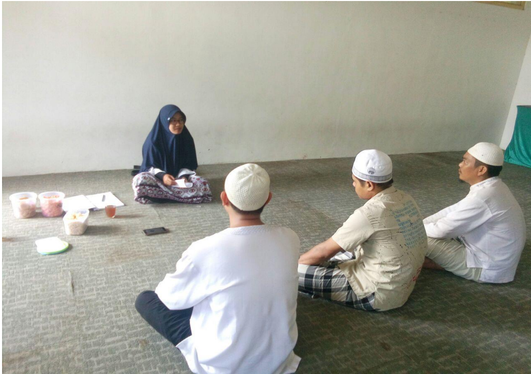
Foto Wawancara Santri Pengguna