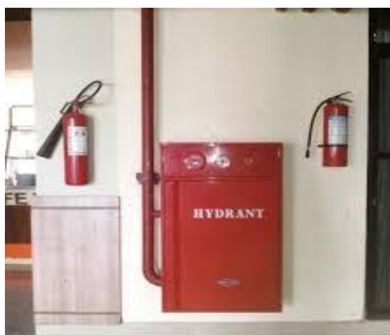
Gambar 2.7 Hidran gedung