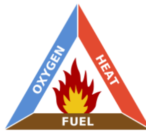
Gambar 2.1 Segitiga api ( fire triangle )