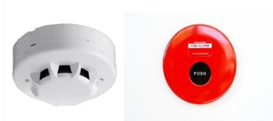
Gambar 2.4 Deteksi asap dan alarm

Deteksi dan alarm adalah sebuah alat untuk mendeteksi dan memberikan peringatan dini jika adanya kebakaran. (Okokpujie dkk., 2019).