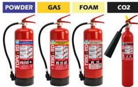
Gambar 2.6 Alat pemadam api ringan (APAR)