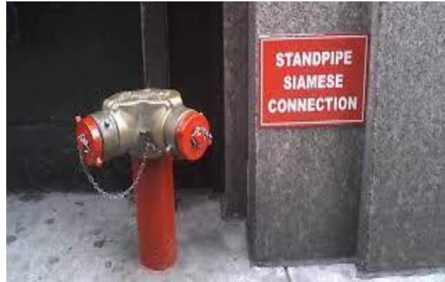
Gambar 2.5 Siames connection