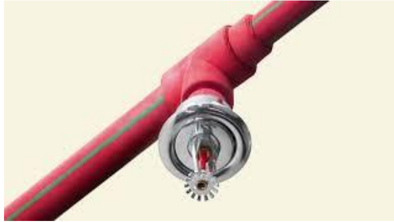
Gambar 2.8 Sprinkler

Sprinkler yaitu sebuah system pemadam kebakaran yang otomatis menyembrotkan air jika terdeteksi adanya kebakaran didalam gedung yang terpasang sprinkler (Napitupulu dkk., 2015).