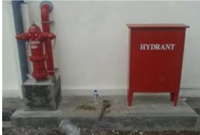
Gambar 2.3 Hidran halaman

Hidran halaman ialah hidran yang letaknya berada di halaman luar atau lingkungan, sedangkan instalasi dan sumber air disediakan oleh pemilik bangunan (Napitupulu dkk., 2015)