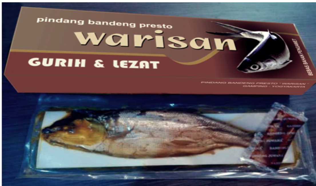
Gambar 1. Pindang Bandeng “WARISAN” Dalam Kemasan

Kedua mitra tersebut adalah Ibu Eko Sayektiningsih yang berdomisili di Desa Balecatur Kecamatan Gamping Sleman dan Ibu Erni Siwi Karyanti di Desa Banyuroto, Nanggulan Kulonprogo.. Hingga sekarang ini kedua ibu tersebut dalam menjual produknya dengan memakai label atau nama produk yang melekat pada palstik atau kardus. Peralatan yang dipakai juga masih sederhana yaitu berupa panci presto dan kompor pemanas, sedangkan untuk pengepakan produk dimasukkan dalam plastik tanpa melalui proses vacuum Kemasan untuk memasarkan pindang bandeng dan olahan bandeng presto tersebut tampak pada gambar 1 dan gambar 2 berikut ini :