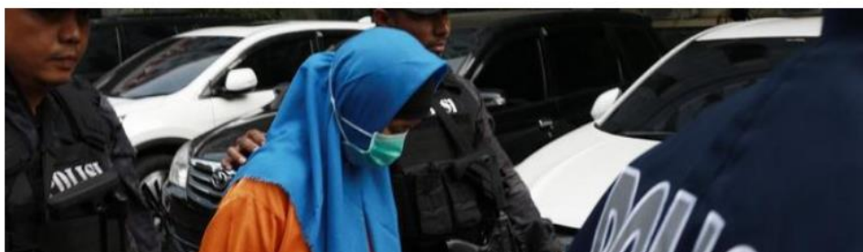
Gambar 1.3 Contoh kasus siaran televisi

Selain masalah ekonomi pelaku mencoba membunuh ayah dan anak dengan cara yang sering di lakukan di sinetron-sinetron seperti santet, membakar garasi rumah dan menghilangkan jejak namun setelah gagal dan merasa panik pelaku membawa dua jasad itu ke sukabumi dan membakarnya disana, aksi pembakaran itu terlintas karena sering menonton tayangan sinetron televisi.