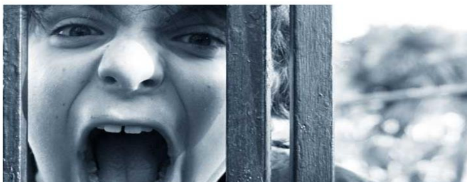
Gambar 1.2 contoh kasus siaran televisi