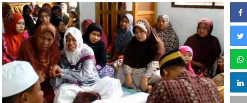
Gambar 1.1 contoh kasus akibat siaran televisi

salah satu nya terjadi di daerah Pekanbaru pada tanggal 27 November 2015 Bocah kelas 1 SD ditemukan tewas setelah di keroyok oleh teman-temannya yang menirukan silat-silatan seperti gaya di sinetron “7 manusia harimau” yang tayang di salah satu televisi swasta nasional. Dalam main-main tersebut, teman-temannya ada yang memukul dengan sapu serta menendang layaknya sinetron laga tersebut.