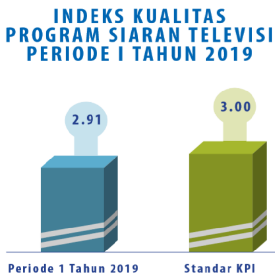
Gambar 1. 4 Grafik Indeks Kualitas Program Siaran Televisi Periode 1 tahun 2019

ini dikelompokkan sesuai kategori siaran seperti, infotainment, sinetron, variety show, talk show, wisata budaya, religi, berita dan siaran anak-anak. Dalam hasil riset yang diteliti KPI dan di bantu dengan 12 perguruan tinggi yang ada di Indonesia memberi kesimpulan bahwa pada tahun 2019 menunjukkan indeks 4 (empat) program yaitu, wisata budaya, religi, siaran anak-anak, dan talkshow yang telah melampaui standar kualitas KPI, sedangkan indeks 4 (empat) program siaran yaitu berita, infotainment, sinetron dan variety show masih belum bisa memenuhi standar program berkualitas. Dikutip dari website resmi KPI Pusat bahwa hasil riset periode 1 di tahun 2019 memperlihatkan nilai indeks kualitas program siaran televisi secara keseluruhan adalah sebesar 2,91. Indeks ini memperlihatkan kualitas program siaran televisi hampir mencapai standar kualitas yang di tetapkan KPI yaitu 3,00.