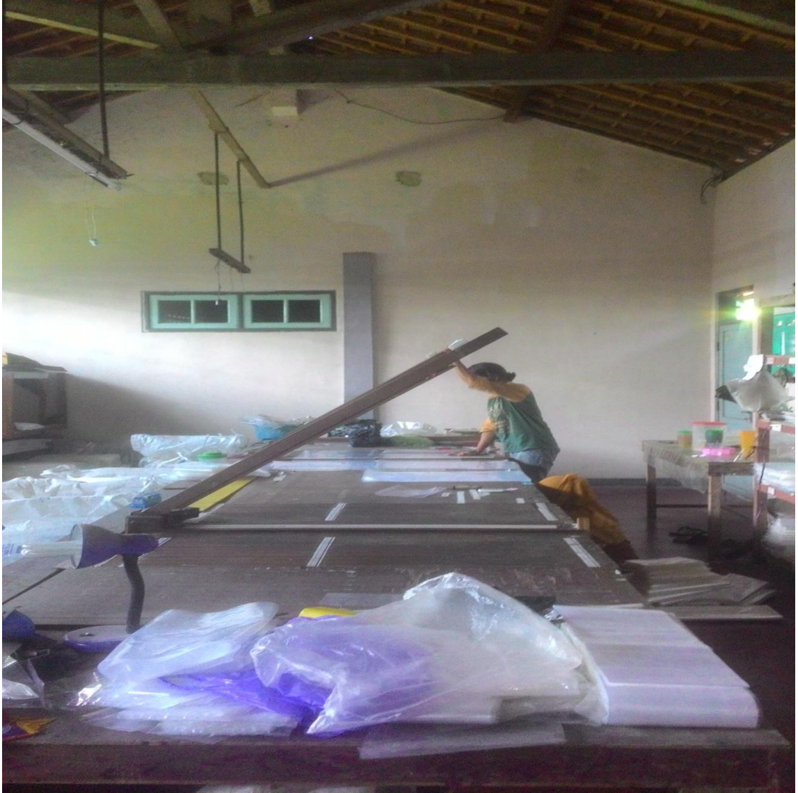
TEMPAT PRODUKSI PLASTIK