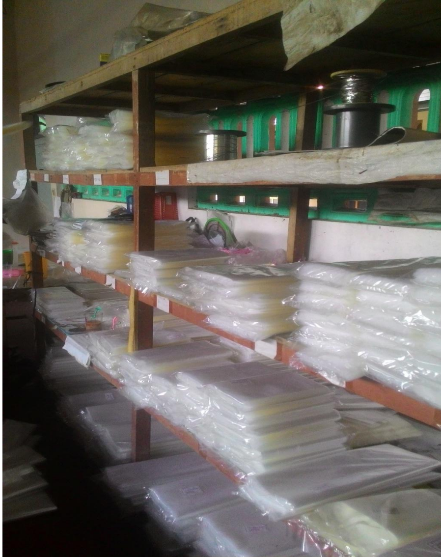
HASIL PRODUKSI INDUSTRI MIKRO